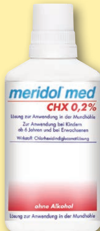
meridol® med CHX 0,2% Lösung 300 ml