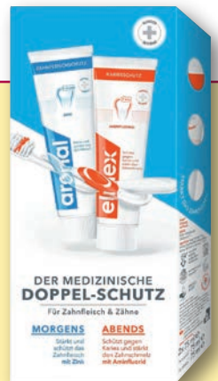
aronal® / elmex® Doppelschutz- zahnpasta 2 x 75 ml