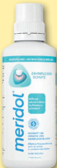
meridol® Mundspülung 400 ml