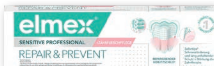
elmex® Sensitive Professional™ Repair & Prevent Zahnpasta 75 ml