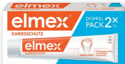
elmex® Kariesschutz Zahnpasta DOPPELPACK 2 x 75 ml