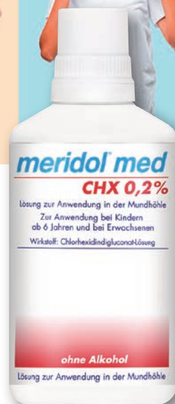
meridol® med CHX 0,2% Lösung 300 ml